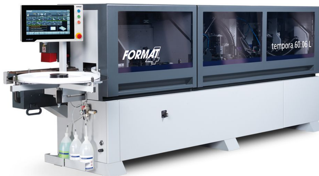
Immagine con equipaggiamento speciale.