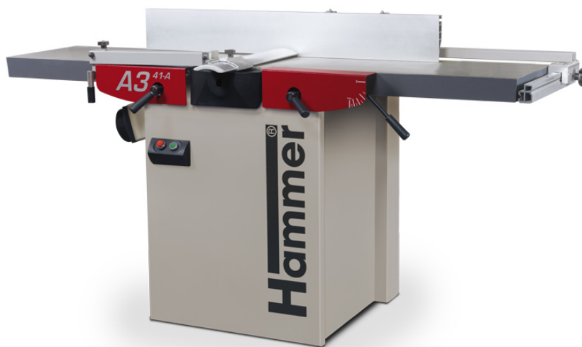
Immagine con equipaggiamento speciale.

La pialla è larga 410 mm, una sensazione, risultati fantastici!