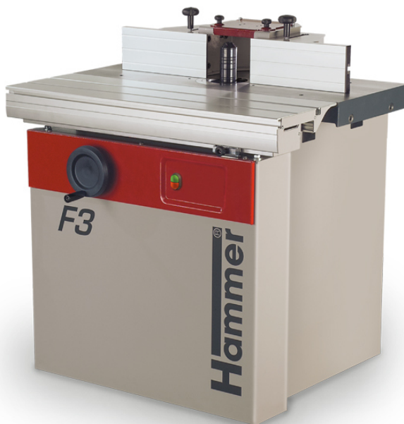
Immagine con equipaggiamento speciale.

Il toupie inclinabile con estrema robustezza e altissimo comfort d'uso!