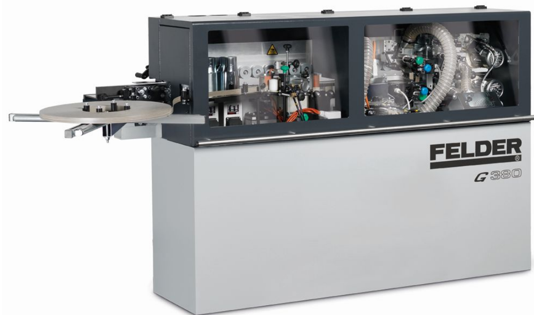
Immagine con equipaggiamento speciale.