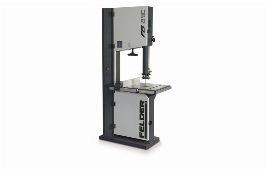
Immagine con equipaggiamento speciale.

FB 510 - La sega a nastro compatta per l'utilizzatore professionista