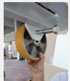
VERSIONE MOBILE AMOVABLE VERSION Particolare ruote gommata / Rubber wheels particular