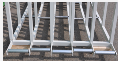
VERSIONE CUSCINETTI BEARING VERSION Particolare rulli frontali e intermedi / Front and middle rolls particular