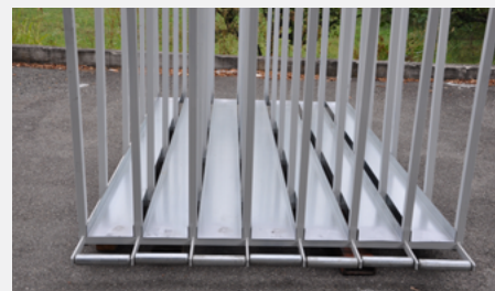
VERSIONE STANDARD STANDARD VERSION Particolare vasche / Tanks particular