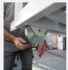
VERSIONE MOBILE AMOVABLE VERSION Particolare ruota per binario / Rail wheel particular