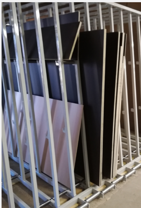
VERSIONE CUSCINETTI BEARING VERSION Particolare divisione intermedia / Middle division particular