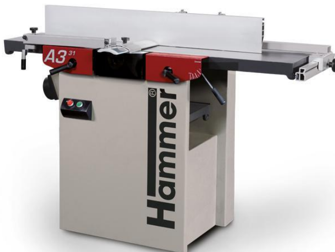
Immagine con equipaggiamento speciale.

La pialla è larga 310 mm, una sensazione, risultati fantastici!