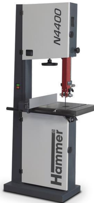
Immagine con equipaggiamento speciale.

La sega a nastro compatta per un uso universale