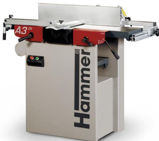
Immagine con equipaggiamento speciale.

La pialla è larga 260 mm, una sensazione, risultati fantastici!