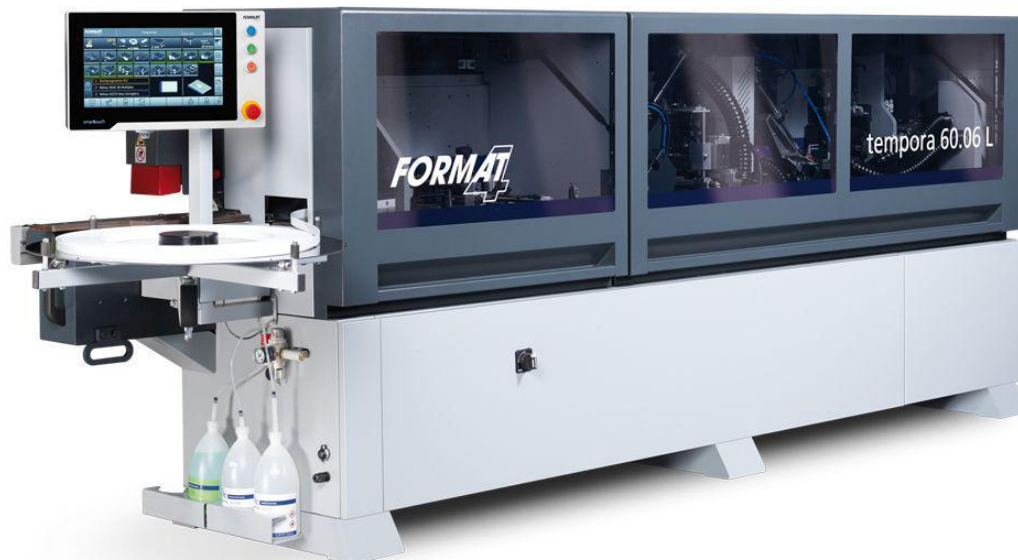
Immagine con equipaggiamento speciale.