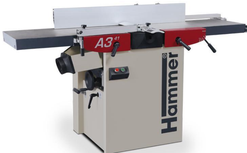
Immagine con equipaggiamento speciale.

La pialla è larga 410 mm, una sensazione, risultati fantastici!