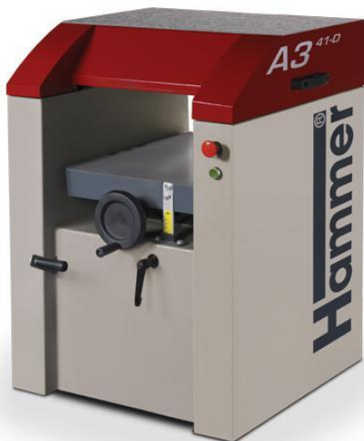
Immagine con equipaggiamento speciale.

La pialla è larga 410 mm, una sensazione, risultati fantastici!