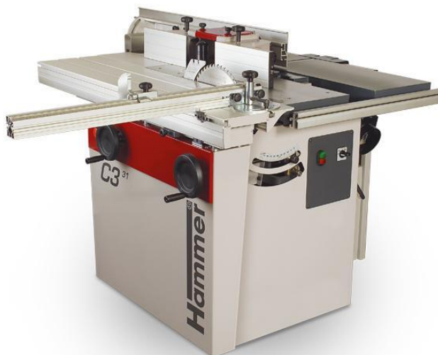
Immagine con equipaggiamento speciale.

La nuova macchina combinata C3 31 esaudirà ogni vostro desiderio