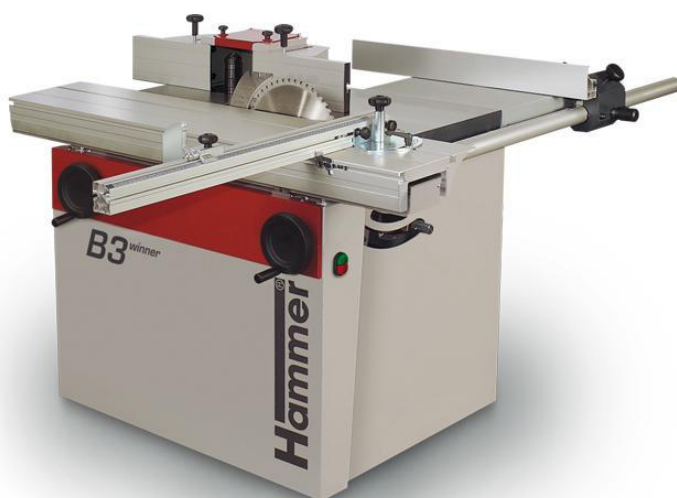
Immagine con equipaggiamento speciale.

„winner“ – il modello collaudato Standard con la possibilità di molti accessori per i lavori professionali.