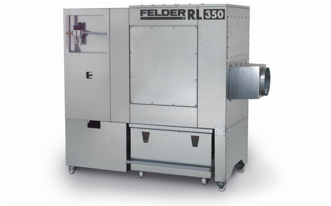
Immagine con equipaggiamento speciale.