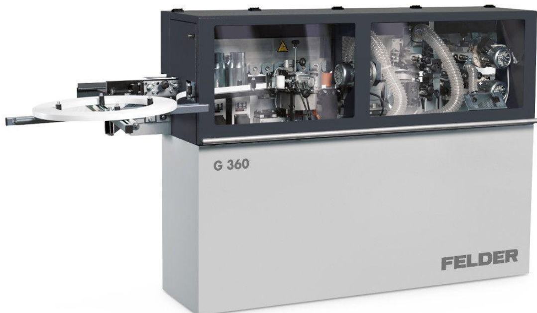
Immagine con equipaggiamento speciale.

Ancora più prestazioni con un nuovo allestimento