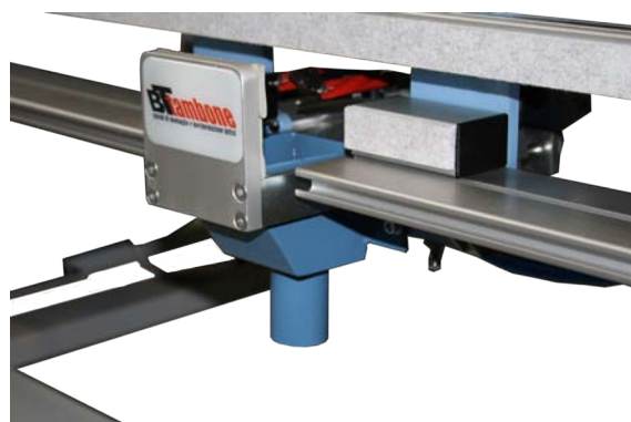
Kit foro maniglia Handle hole kit