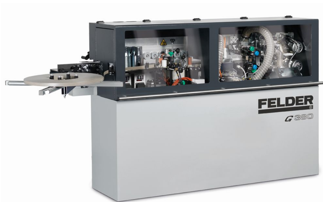
Immagine con equipaggiamento speciale.