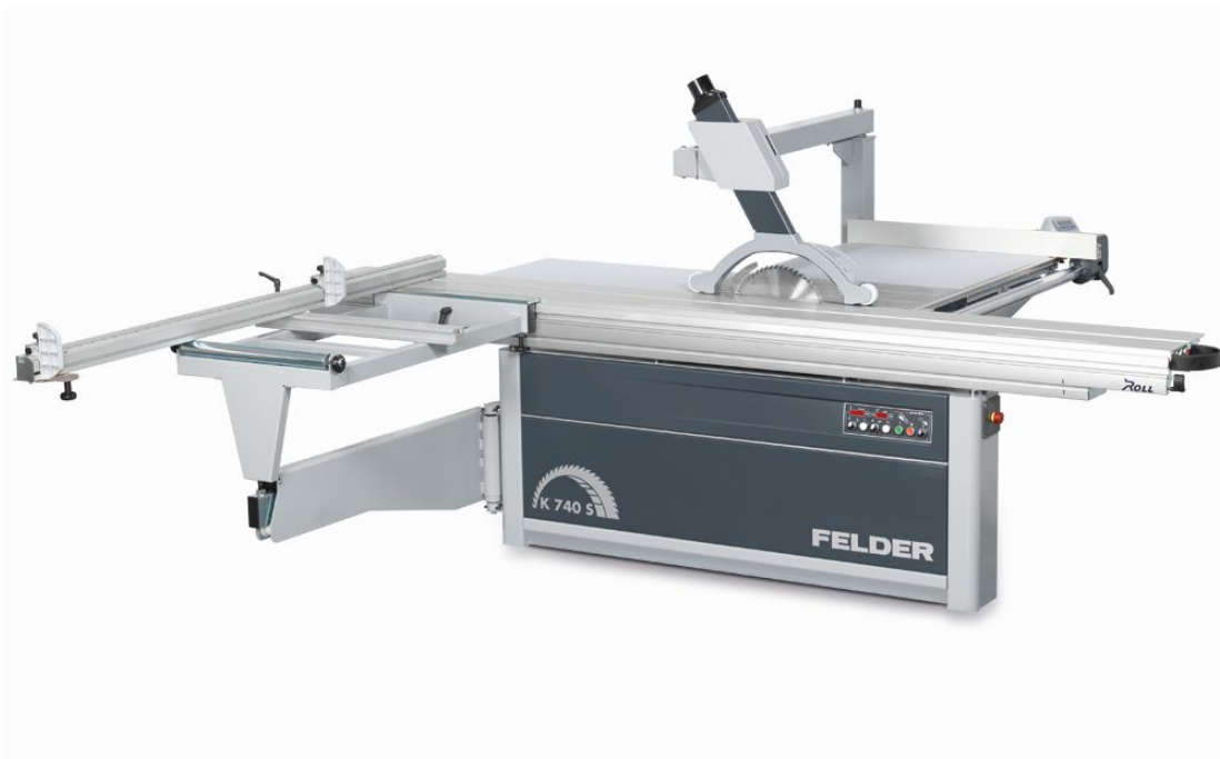
Immagine con equipaggiamento speciale.

Efficienza e precisione senza compromessi