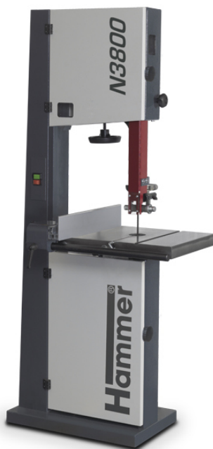
Immagine con equipaggiamento speciale.

La sega a nastro compatta per un uso universale