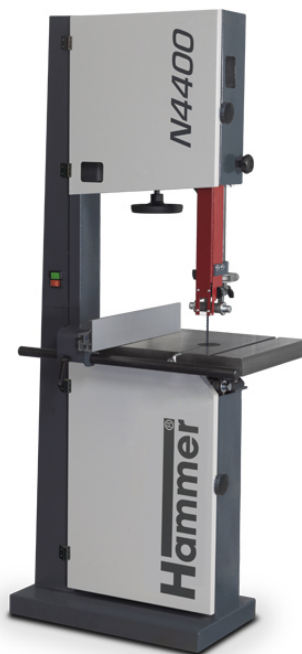
Immagine con equipaggiamento speciale.

La sega a nastro compatta per un uso universale