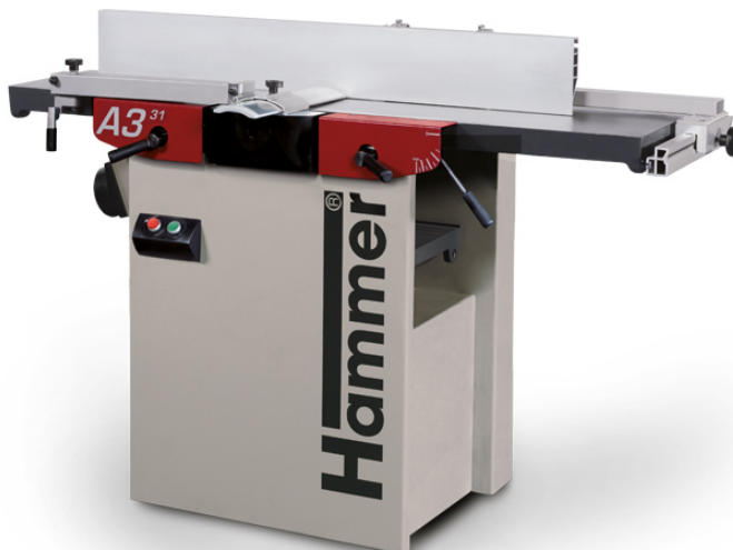
Immagine con equipaggiamento speciale.

La pialla è larga 310 mm, una sensazione, risultati fantastici!